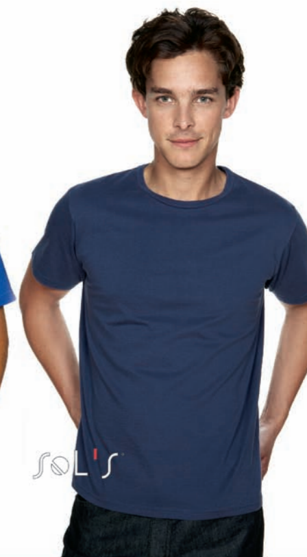
Organic Men 11980